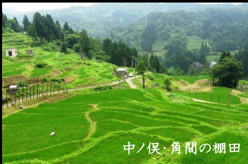
中ノ俣・角間の棚田

有縁の米は、都市とムラの支え合いの仕組みです。 有縁の米は、田んぼも水も森も作り手も、みんなきちんとわかります。