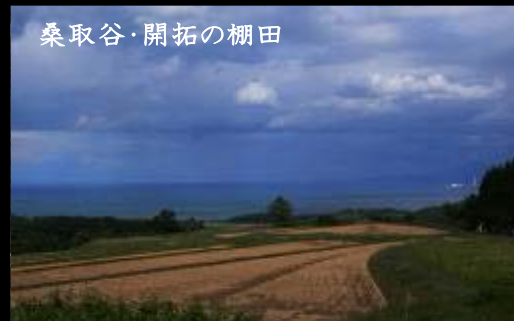
桑取谷・開拓の棚田